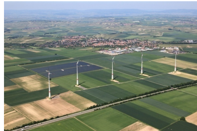
Solarfeld und WEA in Wörrstadt