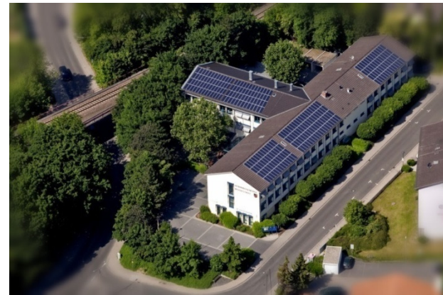
Photovoltaikanlage auf dem Dach des VG-Gebäudes